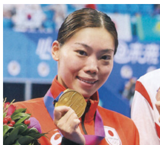
青木玲緒樹 100平泳ぎ金メダル