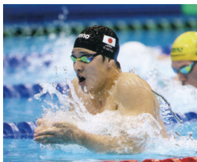
瀬戸大也 400個人メドレー銅メダル

中国、韓国が大躍進。日本も健闘したが、「銀2個」とどまった。競泳、アーティスティックスイミングでは乾友紀子の2冠・2大会連続をはじめ、銀1 銅2 と大健闘。飛込みではメダルこそ獲得できなかったが、玉井陸斗、三上紗也可、荒井祭里がパリ五輪代表権獲得。OWSは混合リレー7位入賞、水球では男子11位女子14位と日本水泳陣は大健闘。