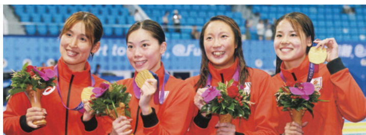
400メドレーリレー金メダル