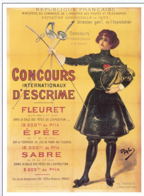
第2回1900年 パリ・フランス 公式ポスター